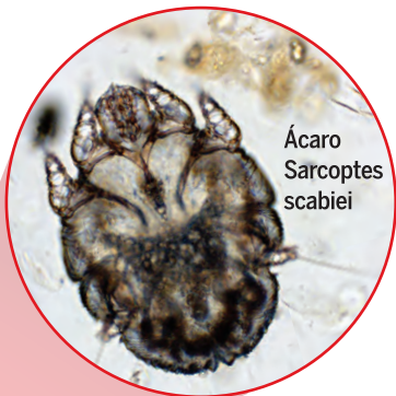
Ácaro Sarcoptes scabiei

O parasita escava túneis sob a pele, onde a fêmea deposita os seus ovos, que eclodirão em cerca de 7 a 10 dias dando origem a novos parasitas